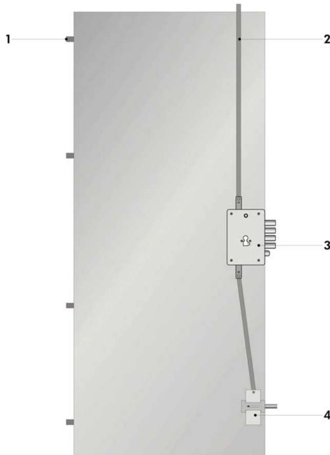
Sistemul de inchidere

Model: NUSCO SILVER Tip inchidere: broasca cu cilindru ( sistem de blocare )